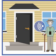
بدون نیاز دست