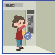
کنترل دسترسی آسانسور